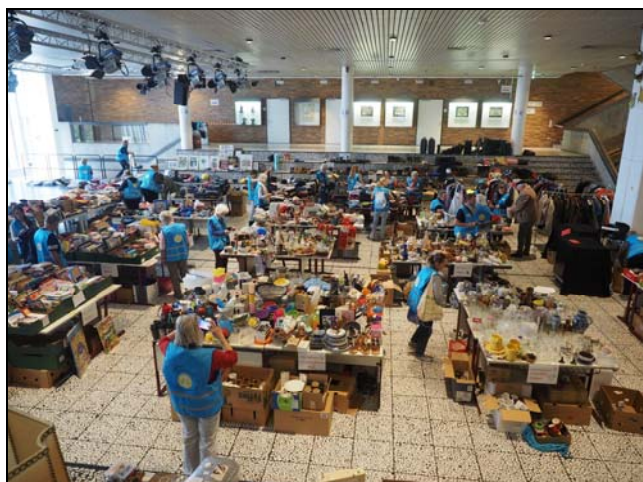
Vormittags sortieren viele helfende Hände die angenommenen Waren

Unser Tauschnetz war am 26.10.2024 zu Gast beim Verschenk-Markt der Aiblinger Tauschfreunde und konnte dort hautnah miterleben, wie ein solcher Verschenk Markt organisiert und durchgeführt wird.