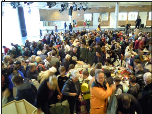
Der Verschenk-Markt ist eröffnet ...

Wir bedanken uns für dieses Erlebnis und die freundschaftliche Aufnahme.