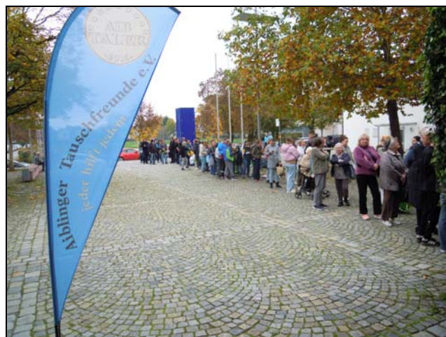
Schon lange vor der Abholzeit stehen die Menschen an, um Sachen mitzunehmen