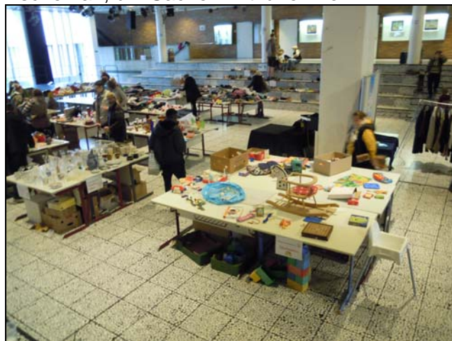
... und es bleibt fast nichts mehr übrig.

Wir bedanken uns für dieses Erlebnis und die freundschaftliche Aufnahme.